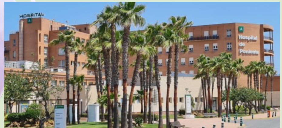
Hospital de Poniente. El Ejido, Almería